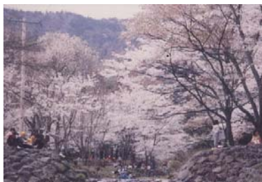
Kamagatani au printemps

À l'arrivée du printemps, de nombreuses variétés de cerisiers fleurissent de concert au bord des ruisseaux : yamazakura , yoshinozakura , shidarezakura , etc. Vue de loins, cette profusion de fleurs de cerisiers fait penser à une brume : c'est ainsi que la vallée fut nommée Kamagatani, « vallée entourée de brume ».