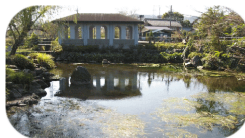
Source à Kami-Yawata où les Hariyo vivent