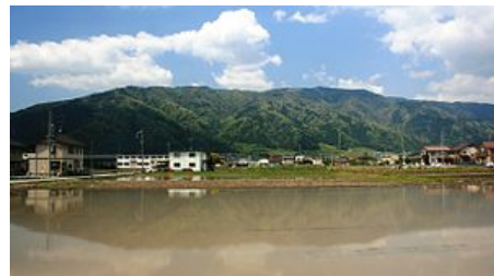
Le mont Ikeda et les rizières s'étendant à son pied

Depuis la vallée de Kamagatani, « monument naturel national » célèbre pour ses cerisiers, jusqu'au sommet du mont Ikeda à 924 mètres au-dessus du niveau de la mer, « la forêt d'Ikeda » est un parc national s'étendant sur une zone de 103 hectares, au sein duquel un chemin de montagne et une chaussée ont été aménagées.