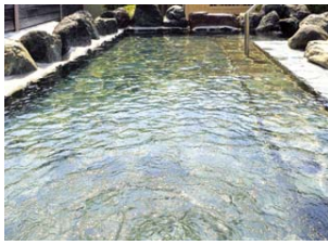
Bain en plein air

Ikeda Onsen, source thermale purement alcaline, ne fait pas qu'embellir la peau : elle est aussi extrêmement douce avec, et la stimule très peu : tout le monde peut donc l'utiliser sans inquiétude, des nourrissons aux personnes âgées.