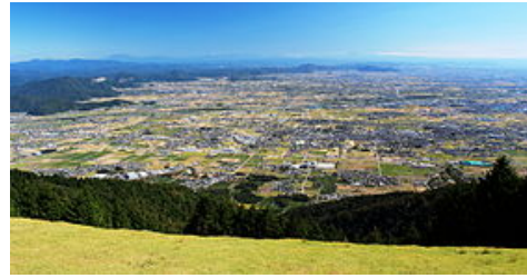
Vue sur le bourg d'Ikeda depuis le mont Ikeda

Le bourg d'Ikeda se situe à l'extrême nord de la grande plaine alluviale de Nōbi, créée par les trois rivières de Kiso (la Kiso-gawa, la Nagara-gawa et l'Ibi-gawa). À l'ouest, se dresse le mont Ikeda à 924 mètres d'altitude, qui occupe un tiers de la superficie du bourg. Le bourg d'Ikeda borde le bourg de Gōdo à l'est et la ville d'Ōgaki au sud, le bourg de Tarui à l'ouest et le bourg d'Ibigawa au nord. La route nationale 417 traverse le bourg du nord au sud : l'emprunter vous permettra d'accéder à la ville d'Ōgaki (12 km) et à la ville de Gifu (20 km).